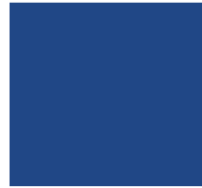
LS Blue BL-54