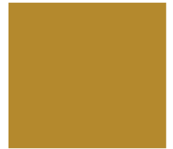
Golden Yellow 305-6003